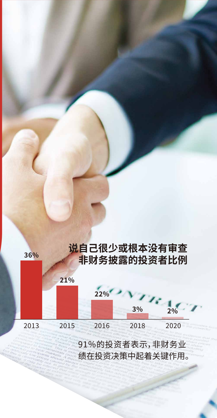
说自己很少或根本没有审查非财务披露的投资者比例

具有社会意识的投资者对公司的环境和社会影响感兴趣。因此通过环境、社会及管治 (ESG) 报告或可持续性报告是企业将此类信息传递给各利益相关者的一种手段。此报告并可提升企业对各种利益相关者的声誉和透明度。您可以任命我们协助您编制担保或非担保ESG报告,以履行相关的上市规则义务。